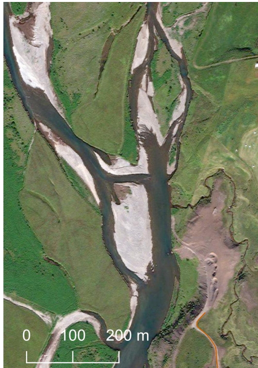
Loftmyndir af Kiðueyri, sú til vinstri frá 1994 og nýleg mynd hægra megin.